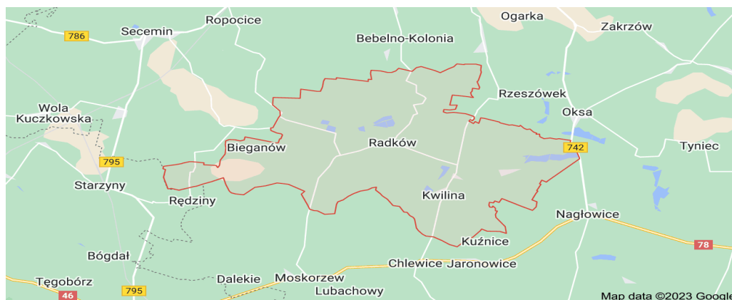
Rysunek 1. Położenie gminy Radków.

W skład Gminy Radków wchodzi 14 sołectw: Bałków, Bieganów, Brzeście, Chycza, Dziergów, Kossów, Krasów, Kwilina, Nowiny – Dębnik, Ojślawice, Radków, Skociszewy, Sulików, Świerków.